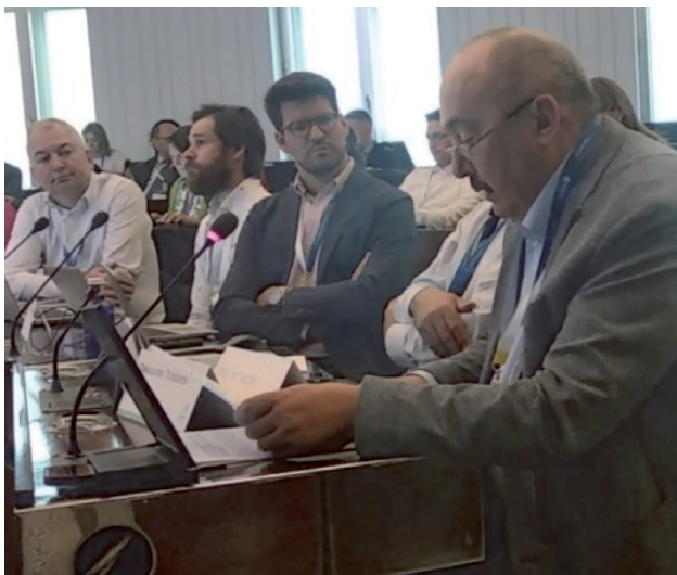
Фото 2. Виступ президента УАСМ професора Олександра Толстанова на засіданні Ради правління Wonca Europe у Брюсселі, 2023