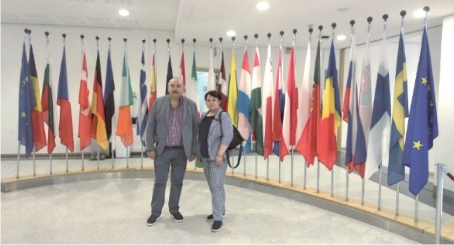
Фото 1. Президент УАСМ чл.-кор. НАМН України, професор Олександр Толстанов та член правління УАСМ професор Вікторія Ткаченко на засіданні Ради правління Wonca Europe у Брюсселі, 2023

Під час засідання правління Wonca Europe затверджено наступні важливі документи з метою подальшого їх представлення політикам і впровадження в європейських країнах на національному рівні: