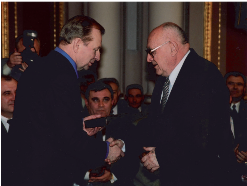
Президент України Л.Д. Кучма вручає А.І.Тріщинському Державну премію України в галузі науки і техніки

У 1964 році з ініціативи А. І. Тріщинського на І конференції анестезіологів, що проходила 3–5 червня 1964 року у Сімферополі (пізніше її назвали Кримською конференцією), було створене наукове Товариство анестезіологів-реаніматологів УРСР – одне з перших у тодішньому Радянському Союзі. Анатолія Івановича Тріщинського було обрано першим Головою новоствореного наукового Товариства [7].