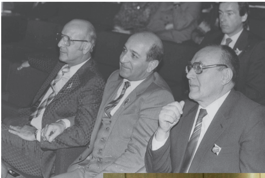
На міжнародних наукових конференціях