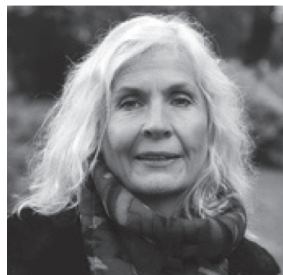
Следующий Президент WONCA World (2020–2022 гг.) Д-р Анна Ставдал (Норвегия)