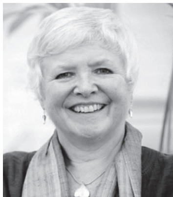
Сложивший полномочия президент WONCA World (2016–2018 гг.) Проф. Аманда Хоу (Великобритания)