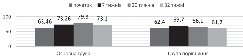
Мал. 2. Зміни показника FEV 1 за період спостереження у пацієнтів з бронхіальною астмою на тлі надмірної маси тіла або ожиріння у процесі застосування лікувально-профілактичного комплексу