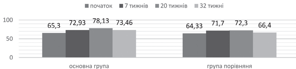
Мал. 3. Зміни показника PEF за період спостереження у пацієнтів з БА на тлі надмірної маси тіла або ожиріння у процесі застосування лікувально-профілактичного комплексу

родними рекомендаціями та побажань пацієнта, та виділено окреме індивідуальне заняття, на якому пацієнт разом з лікарем розбирали етапи застосування інгаляційного препарату та відпрацьовували цей навичок. Після проведених занять 78% від загальної кількості пацієнтів основної групи та групи порівняння почали виконувати дихальні рухи з інгаляційним пристроєм правильно.