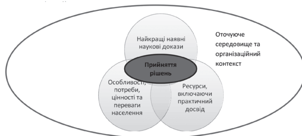
Мал. 1. Домени, що впливають на прийняття рішень у системі доказового громадського здоров'я, доказової профілактики (адаптовано за Brownson R.C. [11])

До даного етапу дослідження, що проводився у жовтні 2018 року, було залучено 52 організатори охорони здоров'я