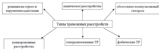
Рис. 3. Типы ПР

сульту распространенность ГТР не снижается, при этом у 3/4 инсультных пациентов с ГТР отмечается и депрессия. Для левополушарных инсультов характерно последующее развитие ГТР и депрессии, а для правополушарных – преимущественно ГТР. Интересно, что поражение базальных ганглиев сопровождается развитием только депрессии, а сочетание базальных и кортикальных очагов нарушения мозгового кровообращения ведет к развитию депрессии и ГТР. В ряде клинико-эпидемиологических исследований показана высокая сопряженность ГТР с такими соматическими заболеваниями, как аллергия, бронхиальная астма, люмбагия, мигрень, болезни обмена веществ, пищеварительного тракта.