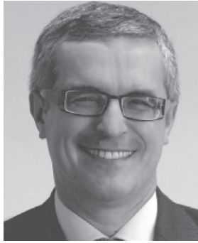
Dr Andrzej Rys (Director for Health Systems, Medical Products and Innovation, DG Health and Food Safety, European Commission)

EU level» («Зміцнення первинної медичної допомоги на рівні ЄС»), в якій було сказано, що сильна первинна медична допомога може сприяти посиленню загальної ефективності роботи систем охорони здоров'я країн ЄС шляхом, зокрема, надання доступної медичної допомоги; координації догляду за пацієнтами та зменшення випадків госпіталізації. Усі системи охорони здоров'я в ЄС стикаються з такими спільними проблемами, як технічний та медичний прогрес, демографічні зміни, зміни захворюваності та смертності з причин інфекційних хвороб чи неінфекційних хронічних захворювань тощо. Це означає, що існує потреба у вдосконаленні первинної медичної допомоги не тільки в кожній державі-члені індивідуально, але і на рівні ЄС. Ініціативи ЄС, спрямовані на краще функціонування первинної медичної допомоги, включають: забезпечення покращення стану здоров'я в ЄС за рахунок зміцнення первинної медичної допомоги та фінансової підтримки Європейськими структурними та інвестиційними фондами, фондом стратегічних інвестицій (наприклад, вже здійснюється така допомога на розвиток центрів первинної медичної допомоги в Польщі та Ірландії).