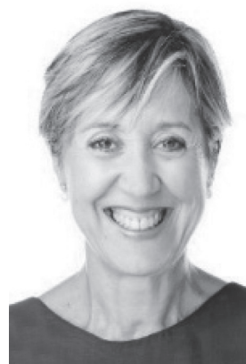
Dr Sera Tort (Clinical Editor, Cochrane Library, Cochrane Editorial Unit, Cochrane Central Executive)

Третьою ключовою лекцією стала промова представника Кокранівської бібліотеки Dr Sera Tort під назвою «How Cochrane can help to achieve quality, efficiency and equity in family medicine» («Як Кокранівська бібліотека може допомогти у досягненні якості, ефективності та рівності в сімейній медицині?»). У доповіді було наголошено, що Кокранівська база систематичних оглядів має збірки систематичних оглядів рандомізованих контрольних випробувань медичних втручань та діагностичних тестів, що можуть стати корисними для забезпечення якісної сімейної медицини. Доступ до цих даних є безкоштовним для країн з низьким економічним розвитком. Крім того, Кокранівська бібліотека працює над новими способами синтезу доказів для полегшення узагальнення знань. Одним із нововведень є Кокранівські клінічні питання – розбори клінічних випадків з керівництвами до дій. Головною метою стратегії Кокранівської бібліотеки до 2020 року є продукція якісних, релевантних, сучасних систематичних оглядів та інших синтезованих дослідницьких доказів для інформування лікарів загальної практики - сімейної медицини про прийняття рішень у сфері охорони здоров'я і сімейної медицини.