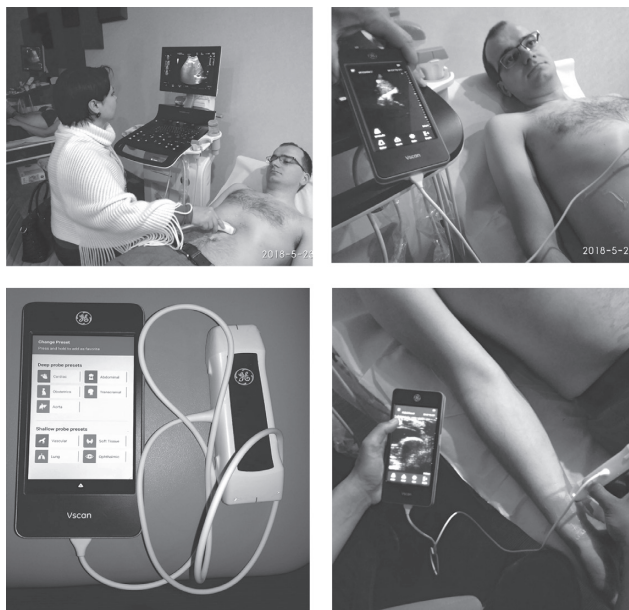
Фото 2. Практична сесія з ультразвукової діагностики в практиці сімейного лікаря з демонстрацією портативного ультразвукового пристрою