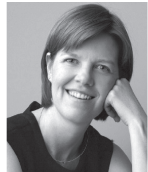
Prof. Sara Willems (First Belgian Professor in the field of equity in healthcare, Head of Equity in Health Care research group)

на тему «Are we all equal? Social differences in health and health care in Europe» («Чи всі ми рівні? Соціальні відмінності у сфері системи охорони здоров'я та стану здоров'я в Європі») констатувала, що люди не народжуються рівними, є великі відмінності у здоров'ї між європейськими країнами. Наприклад, очікувана тривалість життя у країнах Європи різниться в межах від 8 років для жінок та до 14 років для чоловіків. Але всередині кожної країни існує також нерівність у сфері надання послуг охорони здоров'я між соціальними групами і в деяких європейських країнах ця нерівність зростає. Соціальна нерівність у забезпеченні здоров'я зумовлена невідповідністю умов, в яких люди живуть і працюють, а також у таких рушіючих аспектах, як рівень доходу, рівень безробіття та рівень освіти. Медична нерівність не тільки несправедлива, вона також має величезні економічні та соціальні наслідки. Система охорони здоров'я може відігравати важливу роль у зменшенні медичної несправедливості, коли її організація здійснена грамотно та справедливо.