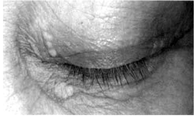
Мал. 1. Ксантелазма у хворого з НАЖХП (стадія стеатозу) та гіпертригліцеридемією

Особливо помітні зміни шкіри у коморбідних хворих, що страждають поєднанням захворювань ендокринної системи та печінки. Неалкогольна жирова хвороба печінки (НАЖХП) найчастіше зустрічається у хворих з ожирінням, з цукровим діабетом 2-го типу (ЦД-2) або предіабетом і є печінковим проявом метаболічного синдрому (МС). Крім того, фіксують зростання числа випадків гіпотиреозу в осіб з НАЖХП, що пов'язане, очевидно, зі спільним патогенетичним механізмом – інсулінорезистентністю (ІР).