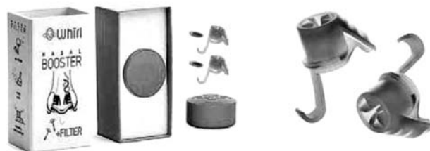
Мал. 2. NASAL BOOSTER Whir (носний підсилювач)

Пристрій зроблений з гіпоалергенного полімеру Medipren (виробник Швеція), який виготовлено з сировини, призначеної для медичного використання, і є аналогом хрящової тканини. Даний матеріал стійкий до пластичної деформації, м'який на дотик, може піддаватись різним видам стерилізації. У конструкції бустера передбачено встановлення змінного фільтра, який затримує шкідливі частинки розміром до 10 мікрон і допомагає уникнути подразнення слизової оболонки носа.